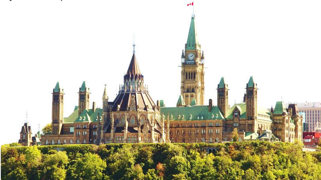
Foto del Parlamento en Ottawa, Canada.

Pero entonces encontramos que en la ciudad de Ottawa hay un edificio gubernamental que tiene una torre con reloj parecido al Big Ben de Londres: es el PARLAMENTO de Canadá (tiene características de verse como castillo como lo vio mi hija en su sueño y hay alrededor suyo, edificios cuadrados como los vio mi hijo en su sueño).