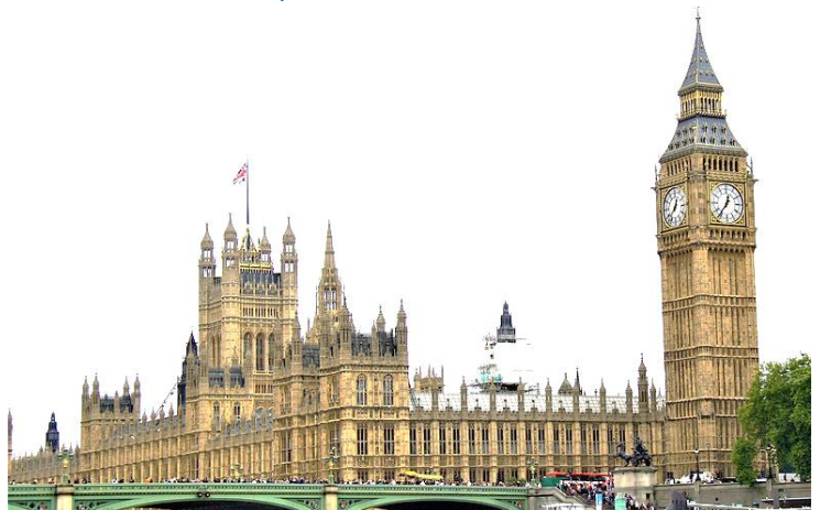
Fotos del Parlamento Británico

Lo que me llama la atención es que no había visto una foto de todo el parlamento británico, pues en la cortina de nuestro baño solo aparece la torre del reloj, pero viendo esta foto completa, veo que si se parece a un castillo como mi hija me decía al contarme su sueño, que estaba en un "edificio" pero igual dice "como un castillo" (por todos los picos que tiene todo el edificio).