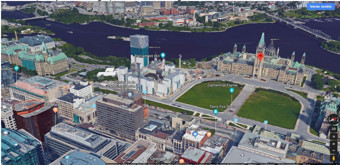
Ottawa Canada.

Pero nos entró la duda si esta sería la ciudad de nuestros sueños porque no está específicamente a orillas del océano, aunque si tiene agua, como se ve en la siguiente foto: