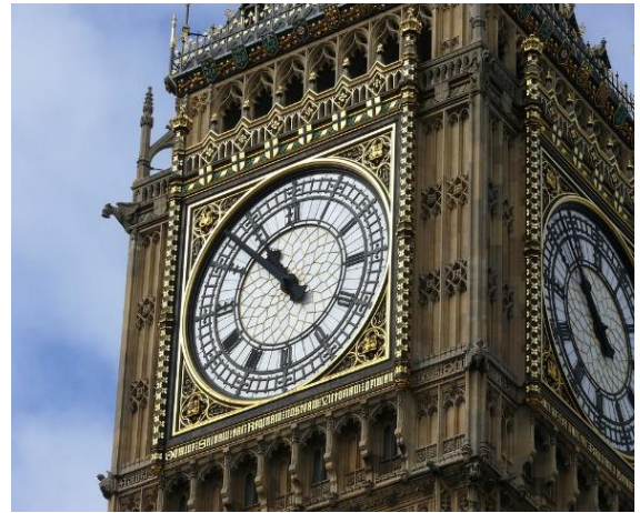
Fotos del Parlamento Británico: El edificio del reloj parece no tener cristales grandes, solo el edificio de enfrente.

Pero al mostrarle las fotos de arriba a mi hijo del BIG BEN con el edificio de enfrente naranja, él me dice que no puede ser este el lugar que vio en su sueño porque el no vio enfrente un edificio con forma de castillo sino uno normal, de "forma rectangular", solo lo vio naranja y color como naranja fuerte. Él me dice que ve como una playa o la ciudad como que tenía la playa o el mar ( yo igual en mi sueño vi una ciudad costera como con playa o laguna o no se...si sería un rio ancho ), y que los dos edificios naranjas estaban en esa área, entonces descarto que sea en el Parlamento de Londres donde podríamos estar para cuando entre el mar, porque no tiene el rio en forma como de playa. Debe ser tal vez en algún lugar de Canadá... Seguiré investigando y pidiendo discernimiento al Espíritu Santo para que me ayude con estos acertijos.